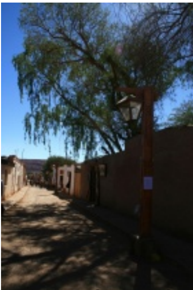
Beschauliche Gassen in S...