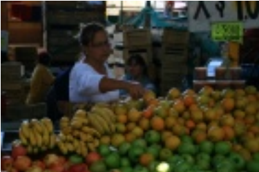
Von jedem Stand sucht Ca...