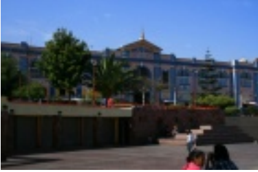
Der Mercado von Antofaga...