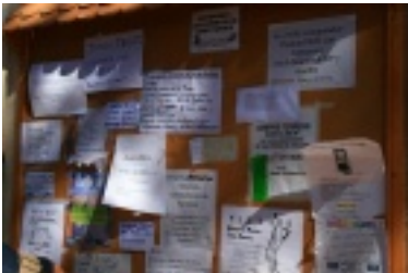
Alles in einem Aufwasch....