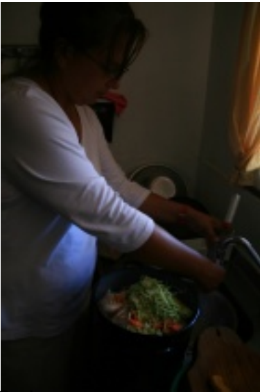
Carla zaubert ein typisc...