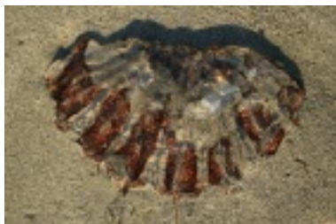
Eine gestrandete Qualle...