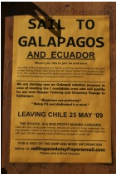
So kann man auch an eine...